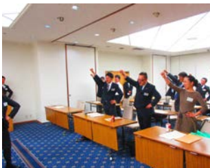
全員で・・・ガンバロー三唱

11月8日(日)札幌市のホテルノースシティにおいて2016年度北海道総支部総会を開催致しました。総会では、運営委員及び代議員が参加の下、前年度の活動報告・会計報告と今年度の活動について計画を確認致しました。2016年度は『更に活動を活発にし、地域での活動や情報発信の活発化』を全員で確認しました。