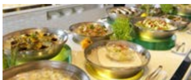
ヘルシーで豊富な品揃え のビュッフェで大満足！

11 月 30 日(日)、帯広地区の事業所にお勤めの組合員とその家族を対象に、支笏湖から千歳市近郊を巡るバスツアーを実施しました。