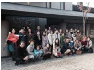
しこつ湖鶴雅リゾートスパ 「水の譚」の前で