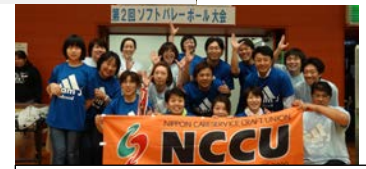
優勝した「チームJ・A」

参加された方々は、この大会に向けて練習を重ね、日頃の体力増強と仲間の結束力にも役立った。来年の大会にもぜひ参加したいとのことでした。