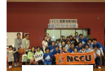
NCCUから参加の3チームと応援団