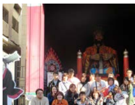
登別温泉・エンマ堂の前で

10月4日(土)、道南支部・函館地区の組合員とその家族を対象に、昨年好評だった『果物狩りと登別温泉日帰り温泉ツアー』を実施しました。ニチイ分会、ジャパンケアグループ分会、やわらぎ分会の組合員と家族、25名が参加。