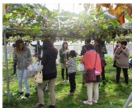
子供たちも大喜び