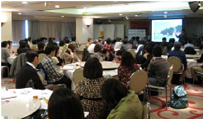
講師の話を熱心に聴く皆さん

研修後の少し早いクリスマス会では、組合員有志による演奏会や全員で参加するゲームなどを行い、同じ地域で働く仲間との交流を深めることが出来ました。