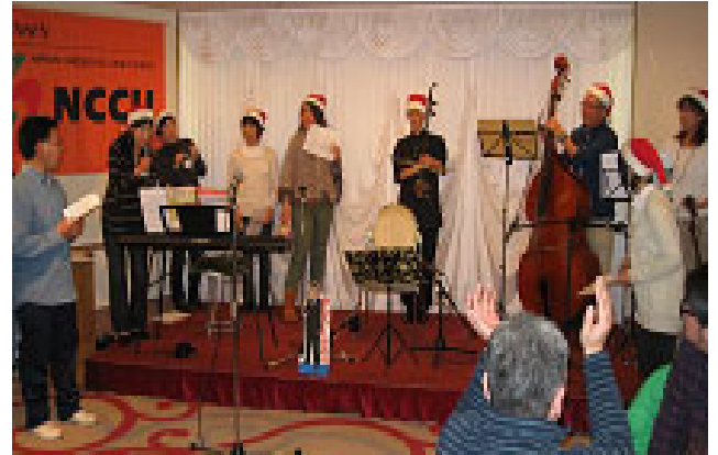
有志による演奏会は大好評でした